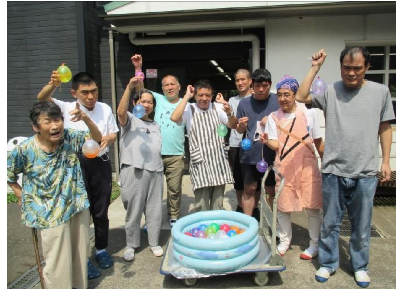
(2023・07・22 休日活動にて)

http://kibounosato.sakura.ne.jp/ E-mail:kibou@river.ocn.ne.jp